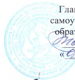
СХЕМА РАЗМЕЩЕНИЯ РЕКЛАМНЫХ КОНСТРУКЦИЙ НА ТЕРРИТОРИИ МУНИЦИПАЛЬНОГО ОБРАЗОВАНИЯ ДИГОРСКИЙ РАЙОН